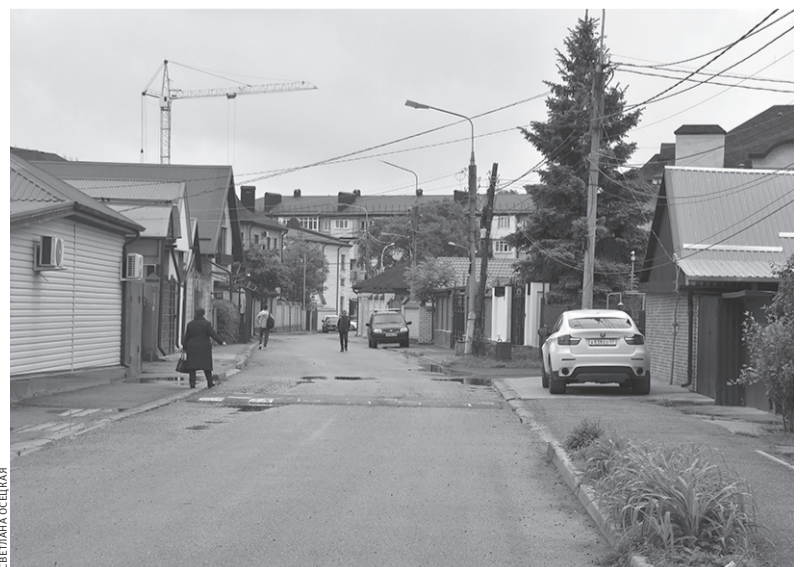
На улице Любови Шевцовой превалирует частный сектор

Сегодня эта тихая неприметная улочка живет своей жизнью, обустраиваясь в соответствии с новыми веяниями. Но память о юной героине, чье имя носит улица, навечно в сердцах всех поколений.