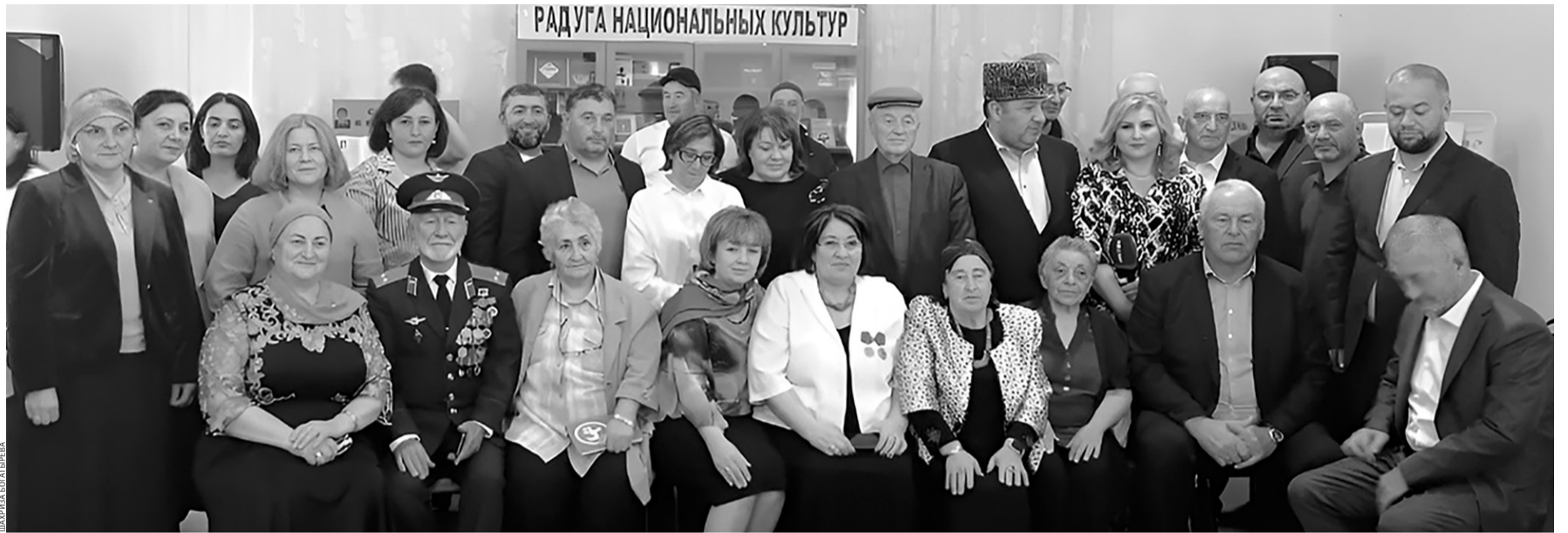
Участники мероприятия сфотографировались на память

Сотрудниками библиотеки были оформлены выставки «Жизнь, посвященная науке» и «С любовью к родной земле» с произведениями и научными трудами Фатимы Эркеновой. Ещё одна выставка, представляющая картины художников Карачаево-Черкесии, украшала стены библиотечного зала массовых мероприятий.